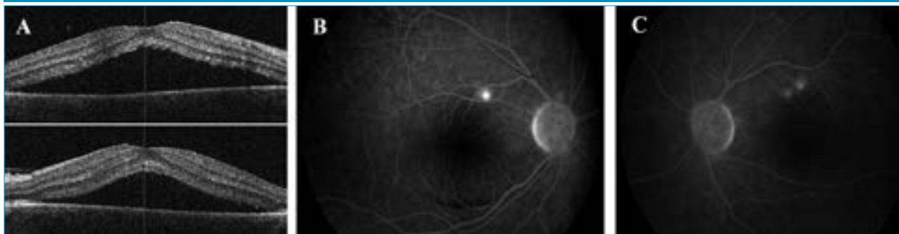
6. ábra: A: Sarcoidosisos beteg mindkét szem makula-OCT-képe szerózus retinleválással szisztémás szteroidterápia mellett. B, C: Jobb és bal szem flurszecein-angiográfiás felvétele gyulladási jelek nélkül, „forró” pontokkal

Következő esetünk: egy 35 éves férfi beteg, akinek anamnézisében 3 hónappal ezelőtti kétoldali panuveitis szerepelt (Vod 0,3; Vosin 0,4). Az elindított általános kivizsgálások sarcoidosist diagnosztizáltak, amelyet pulmonológusok általános szteroidterápiával kezeltek. A szteroidterápia után 6 héttel mindkét szemén látásromlás, centrális foltlátás alakult ki. Felmerült uveitis recidíva lehetősége, emiatt került ismételtan intézetünkbe. Szemészeti vizsgálatok a legjobb korrigált látóélessége mindkét szemén 0,7 volt. Réslámpás-vizsgálat