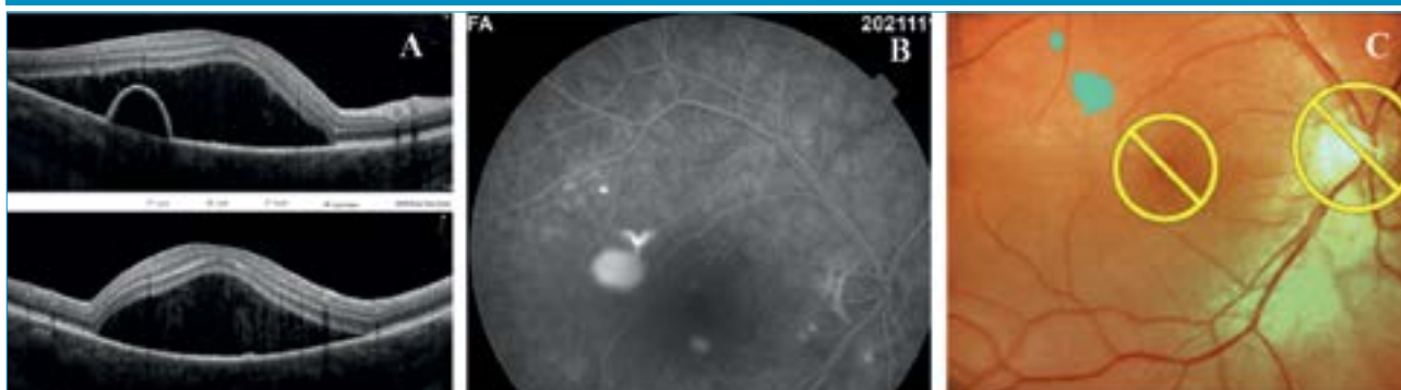
1. ábra: A: OCT-felvétel, a makulatájon magas szerózus retinaleválás látható, a parafoveális területen pigmenthámleválással. B: Jobb szem FLAG-felvétele, fokozódó festékszivárgást mutató forróponttal. C: Navilas subthreshold mikropulzus-lézer által kijelölt kezelendő terület a fundusképen

neuroszenzoros leválás fokozatosan megszűnt, a pigmenthám-leválás jelentősen csökkent és a beteg látóélessége a 3. hónapra 1,0-re javult, ami az eltelt 12 hónapos követési idő alatt tartósan meg is maradt.